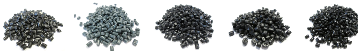
2. táblázat: Elsősorban extrudáláshoz ajánlott HDPE regranulátumok jellemzői